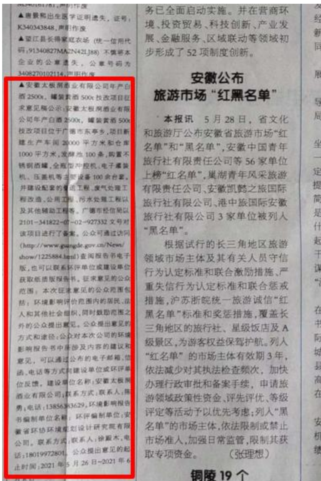
图 3.2-2 报纸一次公示截图