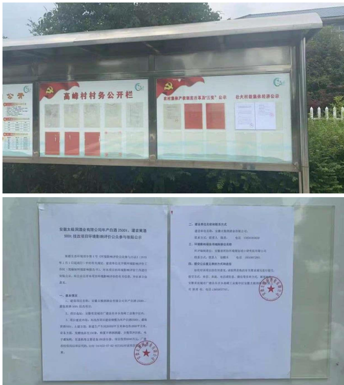
图 3.2-4 高峰村张贴栏张贴公示情况