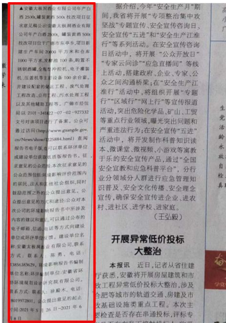
图 3.2-3 报纸二次公示截图