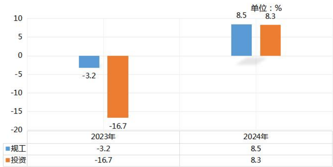
全市规工增加值、固定资产投资增速与上年对比

2024 年全市规模以上工业企业 596 户，2023 年全市规模以上工业企业 538 户，本年比上年净增 58 户。2024 年全年规模以上工业增加值同比增长 8.5%，2023 年全年规模以上工业增加值同比下降 3.2%，本年比上年提升 11.7 个百分点。